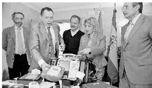
RESPUESTA. El aeropuerto jerezano cuenta con una unidad. / c. o.

En la provincia gaditana, un ejemplo significativo es el aeropuerto de Jerez, pionero en la implantación de estos mecanismos, ya que es de los pocos aeródromos junto con el de Palma de Mallorca, en contar con cuatro de estos aparatos que «reducen hasta en un 30% la tasa de mortalidad por arritmias o afecciones cardíacas», según la Sociedad Española de Medicina Intensiva, Crítica y Unidades Coronarias. Destaca también el centro comercial Bahía Sur de San Fernando, que es el primero de toda